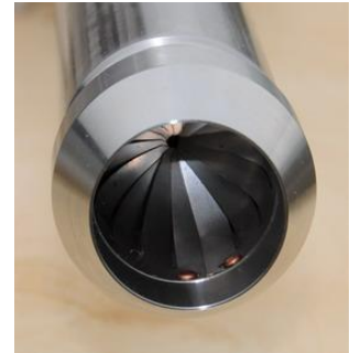
取样管头与橘皮闭合装置