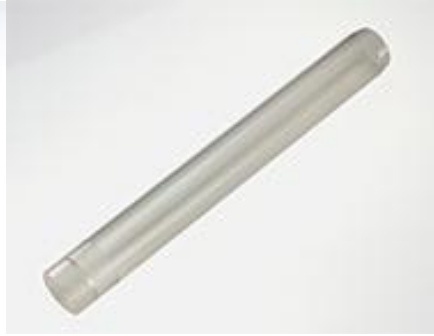
透明亚克力取样管